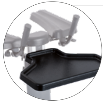
Tablett für den sicheren Transport von Getränken und Essen