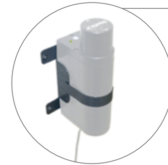
Wandhalterung für Batterieladegerät (Concens)