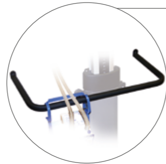
Halterung für Drainagebeutel