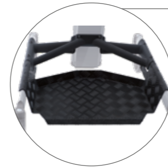
Transportplatte zur Unterstützung beim Personentransport, wenn der Nutzer müde ist