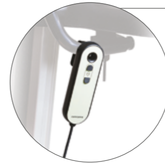
Fernbedienung für TOPRO Taurus E