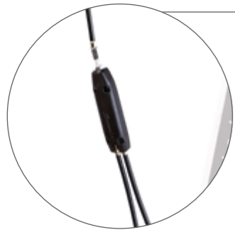
Einhand-Simultanbremse links oder rechts montierbar, zur Einhandbedienung