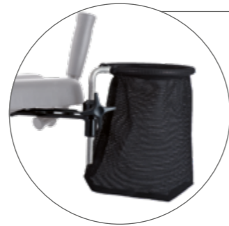
Multifunktionsnetz Zusatzablage im Handgriffbereich, einfach Kleinteile verstauen, bis 2 kg belastbar