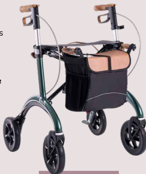
CR54 und CR62

ideal für Stadt und Land – spezielle Reifen für mehr Halt, Komfort und Sicherheit auf jedem Untergrund