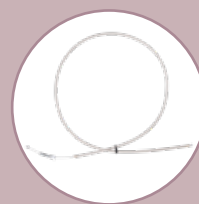
Umbauset für Einhand- Simultanbremse