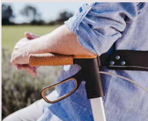
Armauflage aus Kork-TPE

Anti-Rutsch-Pads erleichtern das Ankippen des Rollators