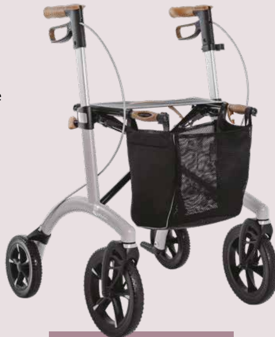
Allround Rollator inkl. Netztasche